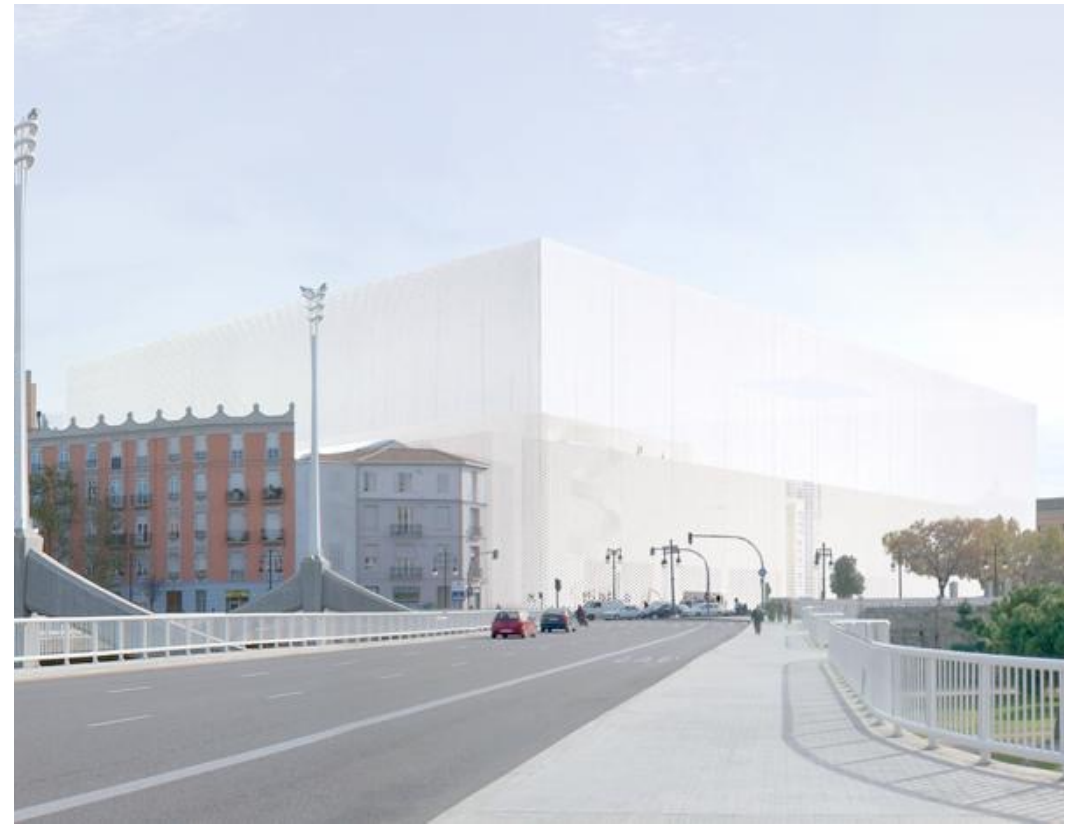
IVAM, València. SANAA Project.