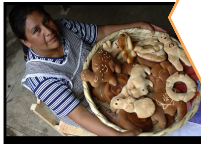
Cocina tradicional mexicana