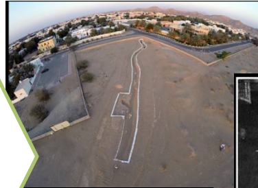
Al Aflaj (Emiratos Árabes Unidos)