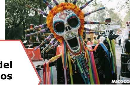
Fiesta del día de los muertos (México)