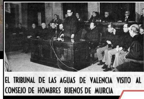
EL TRIBUNAL DE LAS AGUAS DE VALENCIA VISITO AL CONSEJO DE HOMBRES BUENOS DE MURCIA