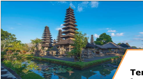
Templos de Agua-Subak (Bali, Indonesia)